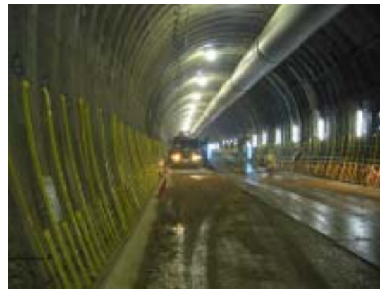
インバート作業状況