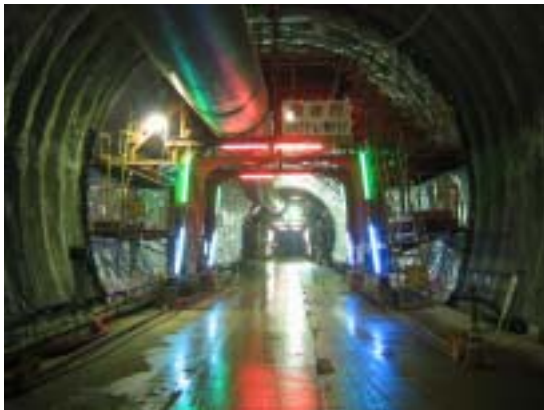
防水シート・覆工作業状況