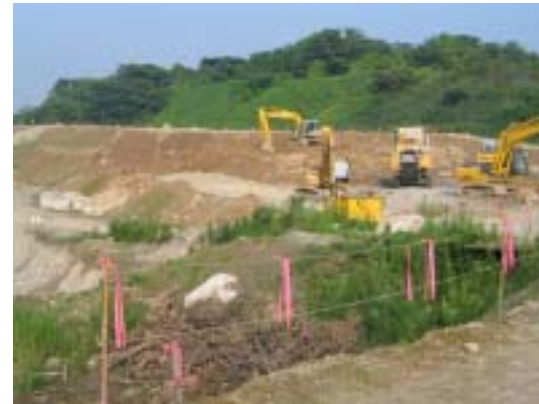
大掛土捨場作業状況